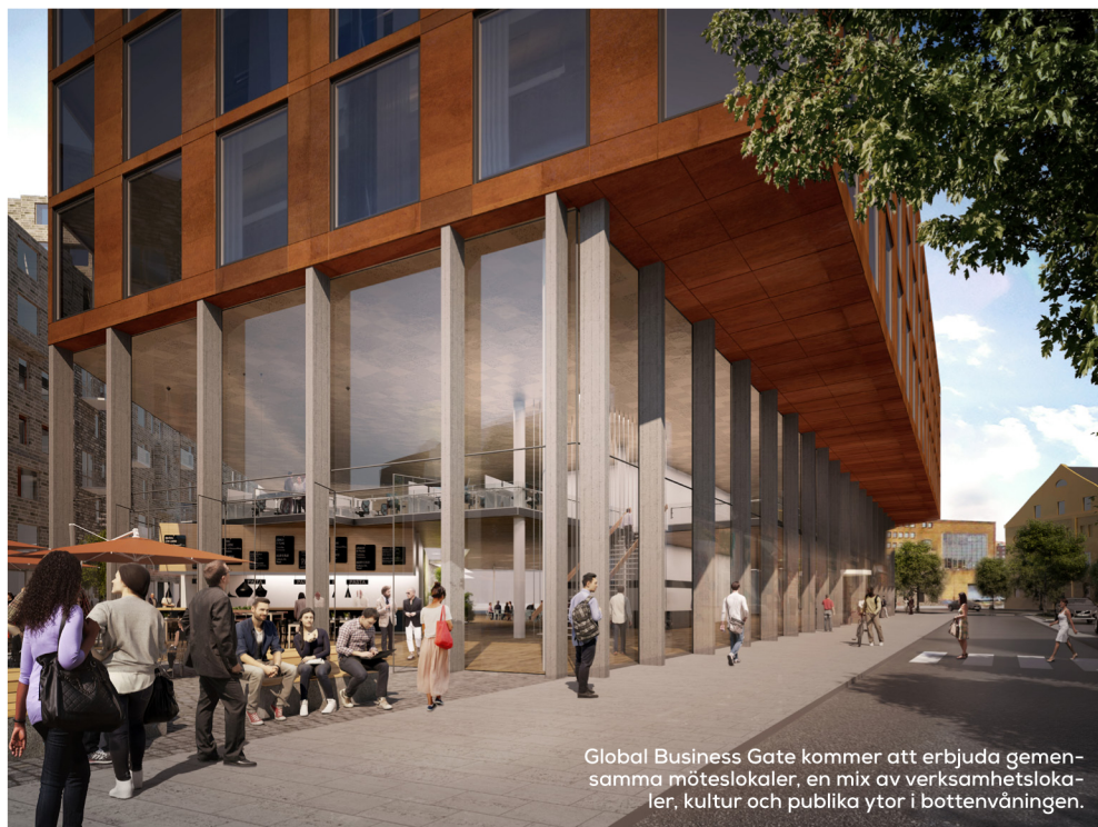
Global Business Gate kommer att erbjuda gemensamma möteslokaler, en mix av verksamhetslokaler, kultur och publika ytor i bottenvåningen.

Byggnaderna kommer att erbjuda gemensamma möteslokaler, en mix av verksamhetslokaler, kultur och publika ytor i bottenvåningen.